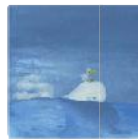
Il sostegno psicologico in oncologia: quando e perché chiedere aiuto Stampa in proprio